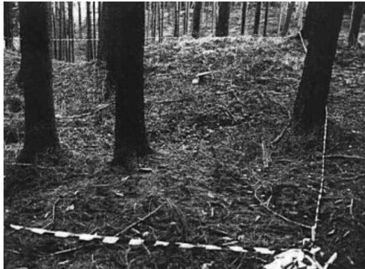
Die austrassierte „Schmiede“ an der Ostseite der Anlage

Am Pfingstsonntag hatten wir dann herrlichstes Sommerwetter, das uns bei unseren Untersuchungen doch recht angenehm war. Am Montag ließ das schöne Wetter dann am frühen Nachmittag nach, doch die anrückende Gewitterfront erlebten wir nur noch auf der Heimfahrt.