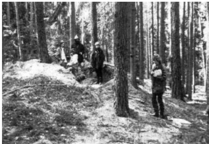
Am Zugang zur Anlage „Schlossberg“ (Foto: Kroeger)

Wir fanden uns nach und nach im Laufe des Samstags (21.05.94) dort ein. Da das Wetter an diesem Tage nicht gerade trocken zu nennen war, spannten wir eine Plane auf, unter der es sich gut aushalten ließ. Wir rekapitulierten zunächst einmal, was wir bisher über den »Schlossberg« und seine nähere Umgebung herausgefunden hatten.