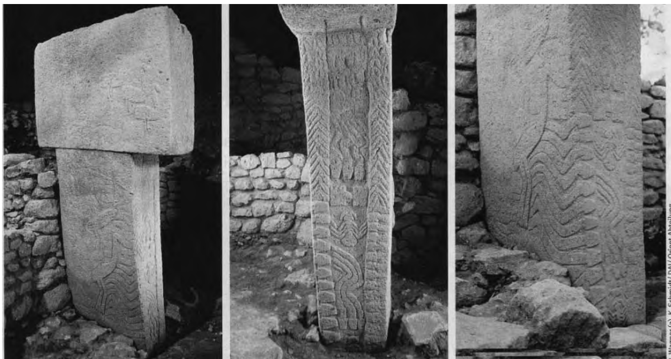
Der Star unter den Stelen auf dem Göbekli Tepe: Die fulminante Tier- und Zeichenverzierung dieses Monolithen geht sicher weit über das rein Ornamentale hinaus. Zunächst schienen auf der einen Seite des Steins nur ein Vogel- und ein Vogel-Wellen-Motiv dargestellt zu sein, doch bei der weiteren Freilegung setzten sich die Wellen auf der Stirnseite in Schlangenköpfen fort. Sie rahmen – zusammen mit einem gleichartigen Band auf der anderen Seite – zwei weitere Schlangenköpfe, eine sechsbeinige Spinne und ein H-Symbol ein.

Ich hatte die Gelegenheit, kürzlich in Konstanz am Bodensee die Wanderausstellung mit der Scheibe zu sehen. Dort war die Scheibe in Fundlage dargestellt (Abbildung 3). Nachdem die Scheibe als Messinstrument nicht mehr benötigt wurde und ihre Zwecke nicht mehr erfüllte, wurde sie – wie