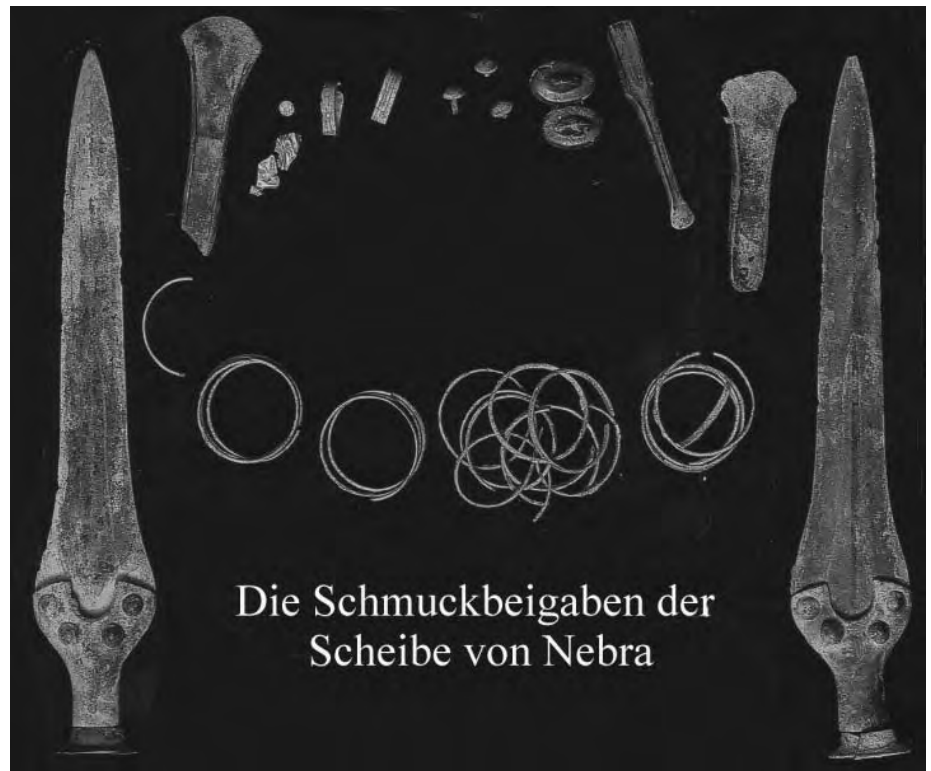
Die Schmuckbeigaben der Scheibe von Nebra

Also kommt eine rituelle Beerdigung nicht in Betracht. In dieser wird das Alte konserviert. Wenn überhaupt, dann läge ein Akt der Selbstzerstörung vor, um die heiligen Anlagen im Teutoburger Wald nicht in die Hand der Feinde fallen zu lassen. Auch für solche Handlungen kennt die Geschichte zahlreiche Beispiele. Aber im Falle der Externsteine?