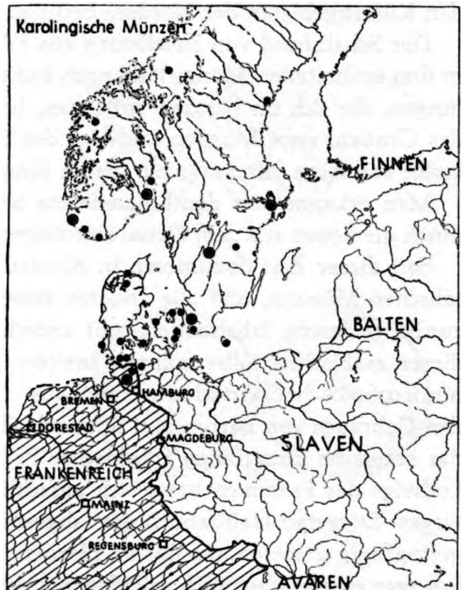
Abb. 5: Karolingische Münzen des 9. Jahrhunderts in Skandinavien.