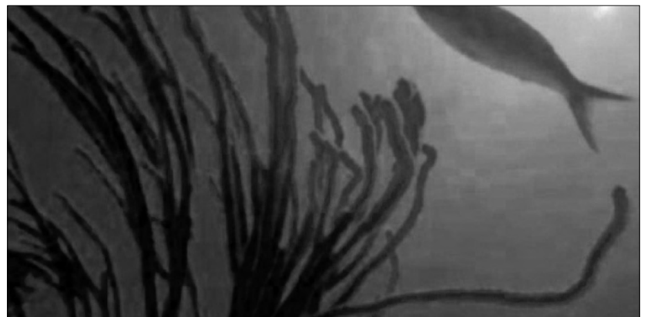
Die Wasserpflanze Zostera bindet Fremdstoffe und schleust diese aus dem Körper.