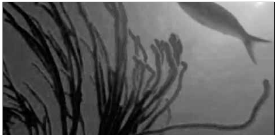
Die Wasserpflanze Zosteriacea bindet Fremdstoffe und schleust diese aus dem Körper.

Die Liste der positiven Wirkungen von Capilarex könnte noch erweitert werden. Als Ballaststoff mit außergewöhnlichen Eigenschaften wirkt Capilarex über diätetische Wirkungsmechanismen. Das Produkt ist daher Lebensmittel und kein Arzneimittel. Weitere Informationen finden Sie u. a. von der deutschen Vertriebsfirma im Internet unter www.causale.de . ■