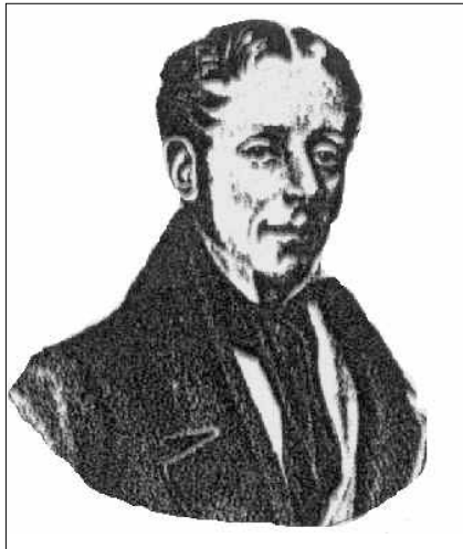
Richard Howard Vyse (1784-1853)

In einer der anderen Kammern fand man eine Kartusche mit dem