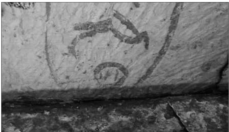
Eines der von Vyse aufgefundenen Zeichen in den „Entlastungskammern“. Die Kartusche reicht bis knapp an den Anschlussstein. Stadelmann bezeichnet sie immer noch (1991) als „Steinbruchinschrift mit dem Namen des Cheops ...“

Sollte Howard-Vyse sie gefälscht haben, dann eigentlich überaus dilettantisch, denn einige der Hieroglyphen, die er an die Wände der „Entlastungskammern“ malte, stehen auf dem Kopf, andere enthalten orthografische oder grammatikalische Fehler und wieder andere sind unidentifizierbar. Solche Fehler wären den alten Ägyptern kaum unterlaufen. Die als „Steinbruchzeichen“ hingestellten Inschriften lauten: