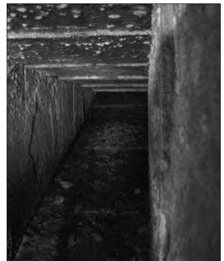
Der Zugang mündet in einen abwärts führenden Gang mit Treppenstufen, der jedoch nach wenigen Metern unter Wasser steht.