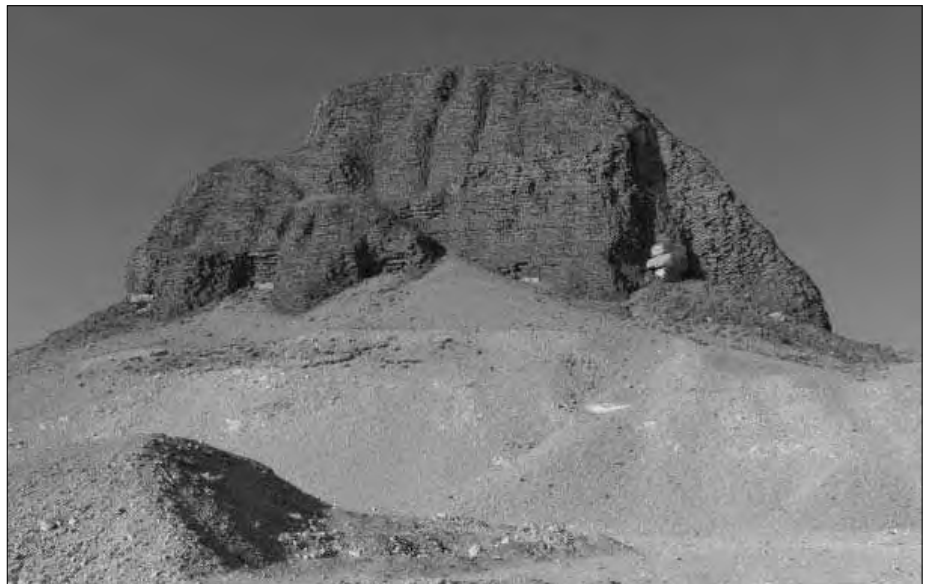
Die Al Lahun-Pyramide. Oben: die Südseite, unten: die Ostseite.