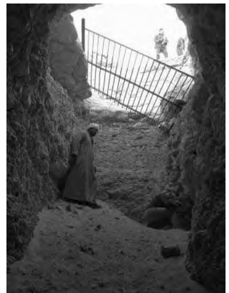
Die Hohlräume und Ausschachtungen sind nur grob bearbeitet.