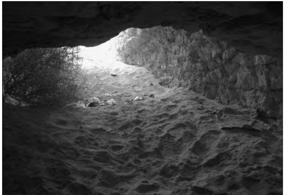
Teilweise muss man auf dem Bauch durch den Sand robben, weil die Durchgänge sehr niedrig sind.