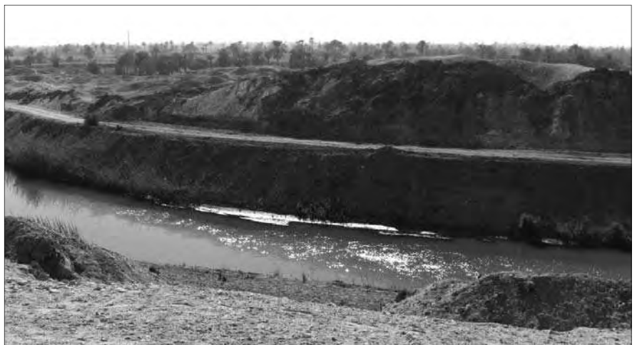
Westlich der Pyramide verläuft ein alter Nilkanal.