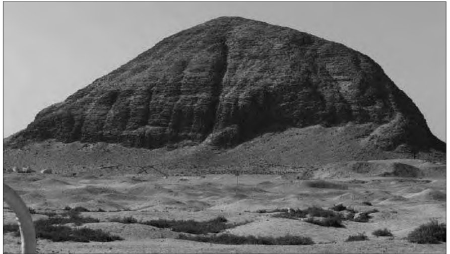
Die Hawara-Pyramide (Ostseite) in El Fayoum.