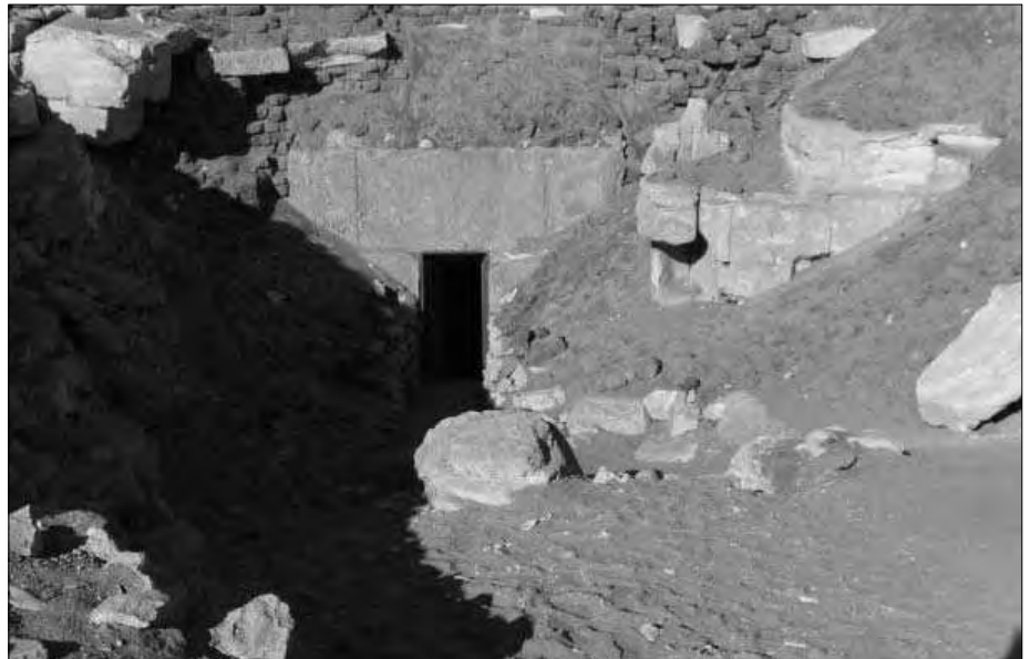
Der Zugang zur Pyramide liegt auf der Südseite.