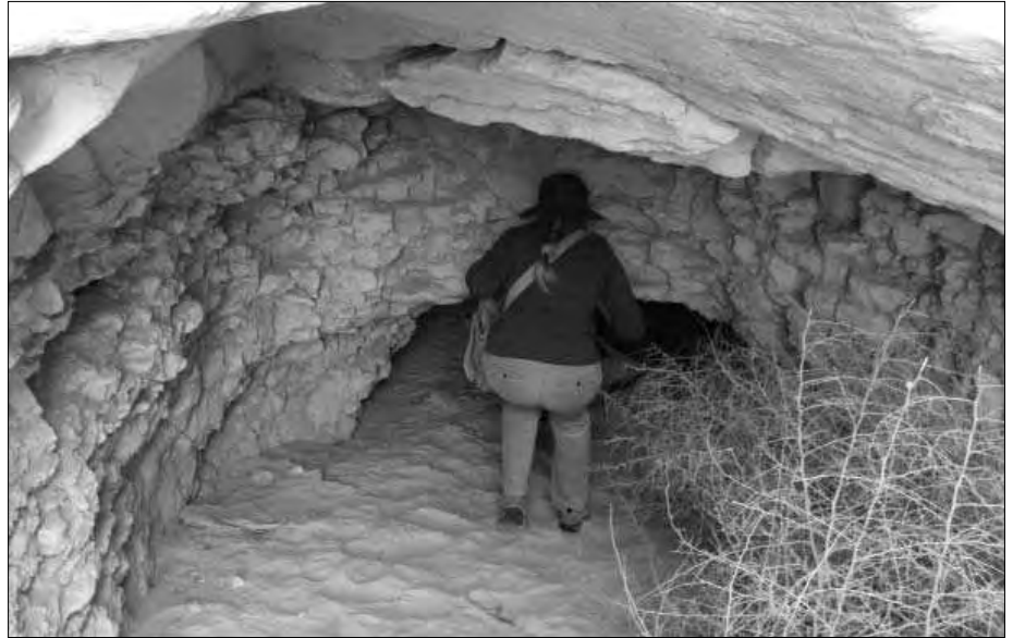
Einer der niedrigen Zugänge liegt auf der Südseite.

Rings um die Pyramide befinden sich Gräber, u. a. auch von Angehörigen des Pharaos, sowie einige recht tiefe Schächte, deren Boden man nur erahnen kann. Neben den Schachtgräbern zweier Prinzessinnen lokalisierte man bei der Suche nach dem Pyramidenzugang an der Nordseite acht Mastaba-Gräber, die jeweils mit Schlammziegeln um einen Kalksteinkern herum errichtet waren, die heute allerdings nicht mehr vorhanden sind. An der Nordost-Ecke befindet sich eine kleine zusammengefallene Nebenpyramide mit einem Basismaß von 27,6 m und einer ehemaligen Höhe von etwa 18 Metern. Bis heute ist es allerdings unklar, ob es sich um eine Königinnen- oder Kultpyramide gehandelt hat.