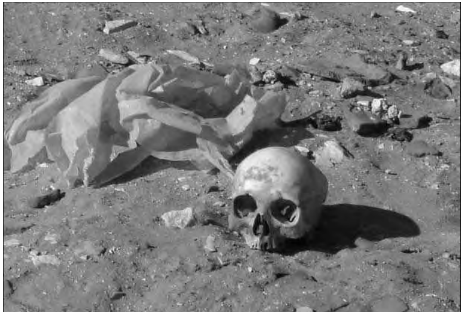
Makaber: In dem Gräberfeld um die Hawara-Pyramide liegen menschliche Knochen und Schädel im Sand.

Ein Eingang befindet sich westlich versetzt auf der Südseite, ist allerdings inzwischen verschüttet, sodass das Innere der Pyramide nicht betreten werden kann. Zwei Schächte sollen dort durch einen horizontalen Gang miteinander verbunden sein, der zu einer Halle mit einer Gewölbedecke führt. Am Ostende