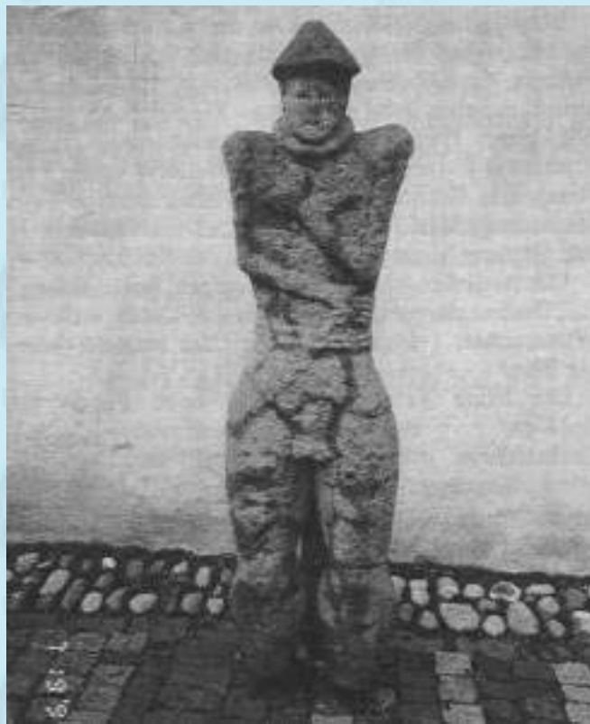
Stele vor dem Heuneburgmuseum