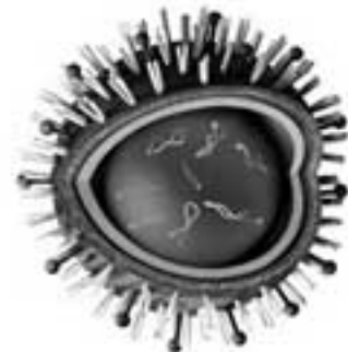
Computersimulation eines Grippevirus

Wenn die Äffchen in der Lösungsphase der akuten Todesangstkonflikte Fieber entwickeln, den Atemtakt von 30 Atmungen auf 100 Atmungsvorgänge pro Minute erhöhen, lethargisch