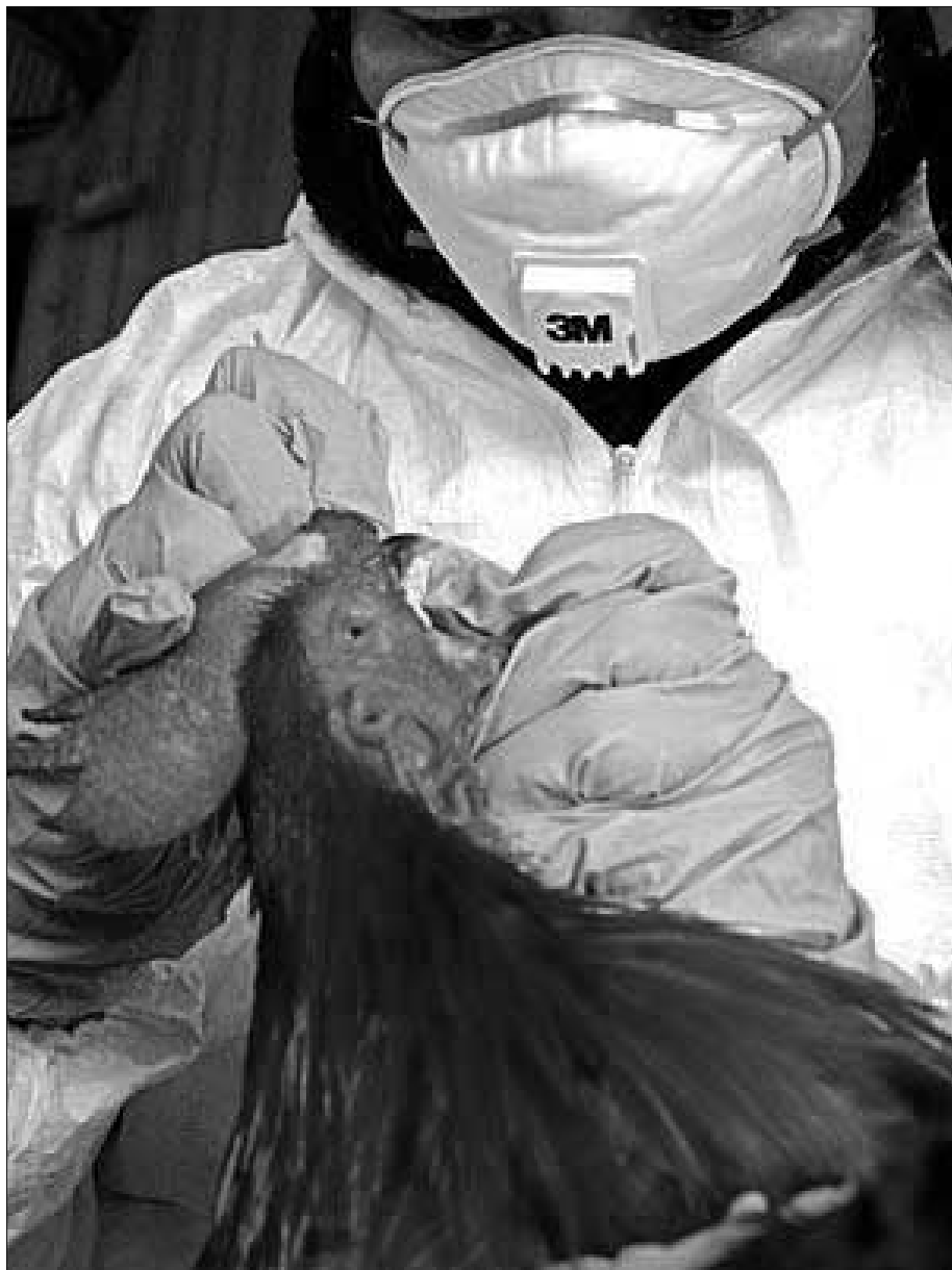
Verdacht auf Vogelgrippe: In China wurden 1,1 Millionen Tiere untersucht (AFP)

Bundestag von der Bundesregierung zwingend abverlangt, dass die Bundesregierung wiederum von den wissenschaftlichen Bundesgesundheitsbehörden, die dem Bundesministerium für Gesundheit unterstehen, die an Wissenschaft zwingend zu stellende Verpflichtung zur Wissenschaftlichkeit, d. h. zur Wahrhaftigkeit und Überprüf- und Nachvollziehbarkeit bei den durch die wissenschaftlichen Bundesgesundheitsbehörden (RKI, PEI u. a.) getätigten politisch und administrativ relevanten Tatsachenaussagen abverlangt, auch im Zusammenhang mit Tatsachenaussagen durch die wissenschaftlichen Bundesgesundheitsbehörden im Zusammenhang mit der global geplanten, nur virtuellen Vogelgrippepandemie und beispielsweise die Behauptung der Fotografierbarkeit eines Konsens durch die wissenschaftlichen Bundesgesundheitsbehörden nicht wieder duldet und