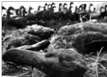
Notgeschlachtete Enten in Thailand. Die Behörden hoffen mit diesen Maßnahmen die Ausbreitung des Vogelgrippe-Erregers in Schach zu halten.

In oben genannter Publikation kann man nachlesen, wie der kleine Junge im Grippepanikjahr 1997 durch Ärzte zu Tode gebracht wurde und wie plumpdreist vorgetäuscht wird, dass aus ihm das gefährliche Hühnergrippevirus H5N1 isoliert wurde, von dem behauptet wird, dass es ihn getötet hat. In einer weiteren maßgeblichen Publikation, die auch vom Abteilungsleiter der Abteilung für übertragbare Krankheiten am