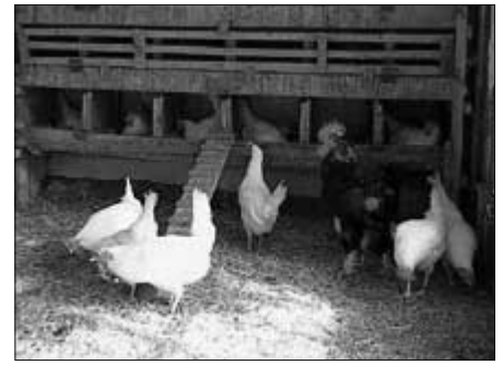
Geflügel muss ab dem 25. Oktober bis am 15. Dezember 2005 im Stall gehalten werden.

Von Dr. med. Markus Betschart , dem Leiter des Kantonsarzt-Amtes des Kantons St. Gallen, bekam er eine Seite, einen Ausdruck aus dem Internet, ohne jegliche Literaturangaben, die eine Überprüfung hätten erlauben können und eine Kopie einer Empfehlung zur Grippeprävention des Bundesamts für