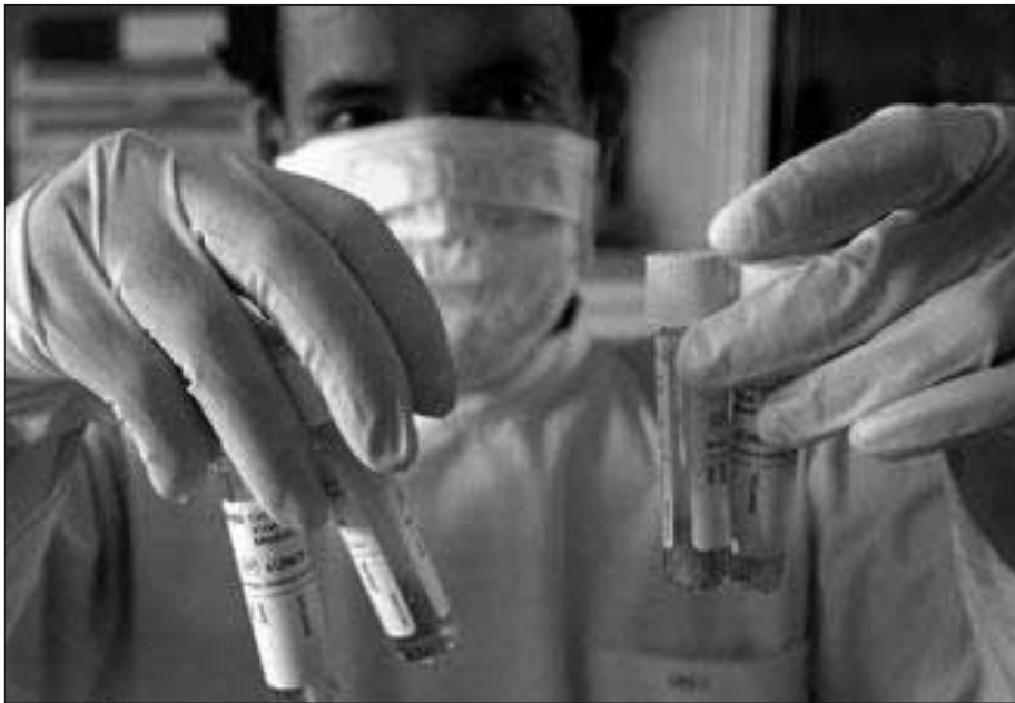
„Dem tödlichen Virus auf der Spur“

zur Bewachung von Apotheken vorgesehen, in denen die irreführende Mehrheit der Bevölkerung rettende Medikamente vermuten wird. ■