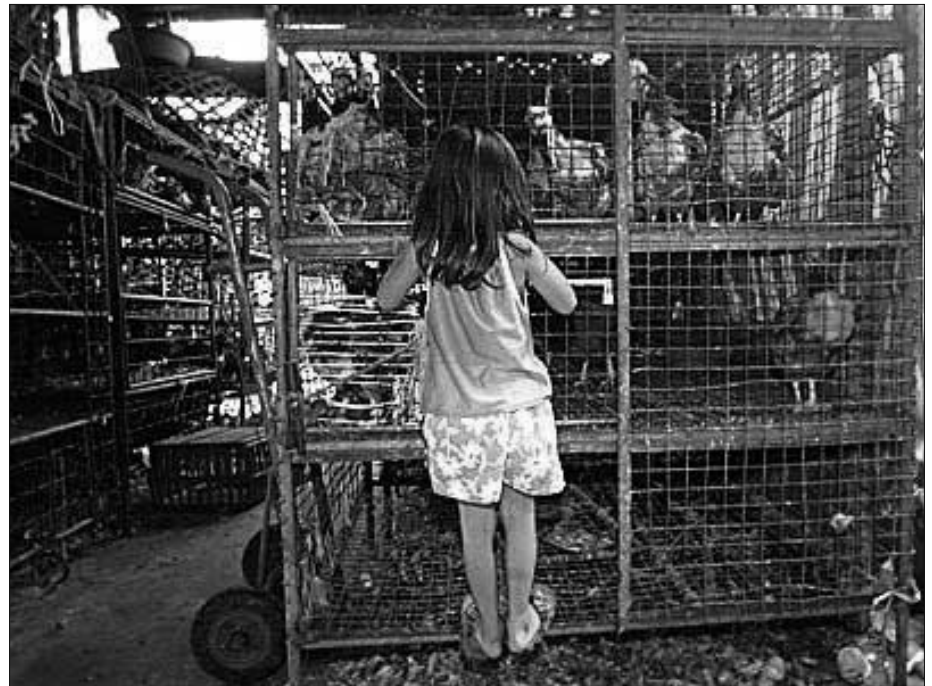
Thailand: Zehntes Todesopfer - nach Vogelgrippe?

zielten Umgang mit Zellen in Plastikschaalen ausgelöste Erscheinungen auf das Wirken des behaupteten Virus zurückgeführt und diese Erscheinungen vorsätzlich wider besseres Wissen mit der Existenz und Isolation des behaupteten Virus gleichgesetzt.