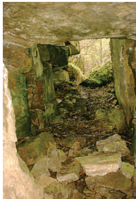
Blick aus dem Innenraum des zweiten Grabes in Richtung Zugang

Die meisten Steinblock-Reste und -Haufen sowie die zwei Ganggräber be-