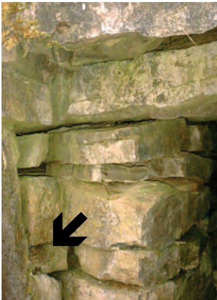
Ganz links am Bildrand die linke vordere Deckplatte mit der inneren Aussparung