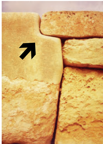
Zum Vergleich: Der Megalith-Tempel Hagar Qim auf Malta zeigt eine ähnliche Verarbeitung

des Knickganges aufmerksam. Der noch stehende Außenblock auf der linken Seite besitzt auf der zum Hügel weisenden Seite eine erkennbare Aussparung im oberen Drittel, auf welcher Tragsteine des Hügels aufliegen. Hierdurch wird nicht nur die Stabilität der aufliegenden Steinriegel, sondern auch des senkrecht stehenden Steinblockes garantiert, er kann nicht nach vorne wegkippen. Dabei handelt es sich um ein typisches Detail megalithischer Bauweise, wie es auch in anderen Megalithanlagen angewendet wurde, beispielsweise in den megalithischen Tempeln auf der Insel Malta.