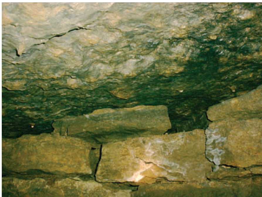
Die Deckenplatten wurden auf die Seitenwände aufgelegt, ein Zeichen dafür, dass der Gang auf ebener Fläche angelegt worden und der umgebende Hügel erst danach angeschüttet worden ist.

Dass die Anlage lange Zeit dem Steinabbau gedient hatte, ist unbestritten. Die Behauptung, es würde sich hierbei um einen alten Steinbruch handeln, hat sich jedoch nicht halten können, denn nach wie vor konnte keine Abbruchstelle gefunden werden. Man hat also nur schon vorhandene große