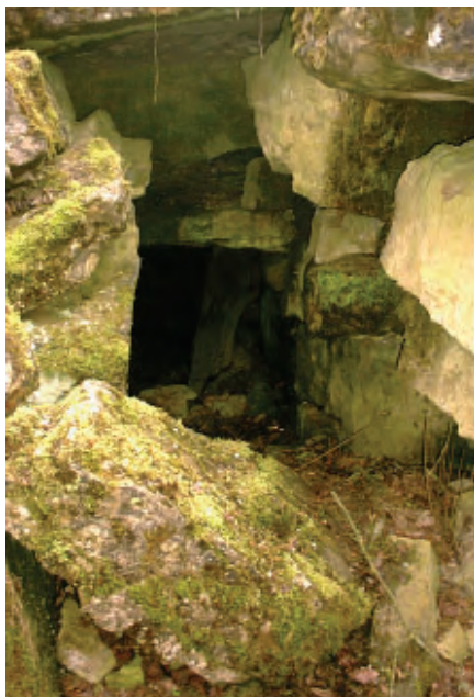
Der Zugang zu dem zweiten von uns gefundenen Grab

mehrfach genutzt wurde. Reste einer ehemaligen Tür sind jedoch auch hier inzwischen verschwunden.