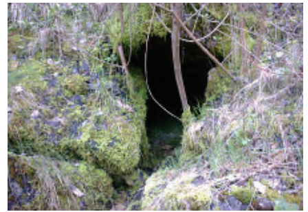
Der ehemalige Zugang eines dritten Grabes. Unmittelbar dahinter ist der Gang zusammengebrochen.

Marsberg: Gernot L. Geise Malta: Wilfried Augustin