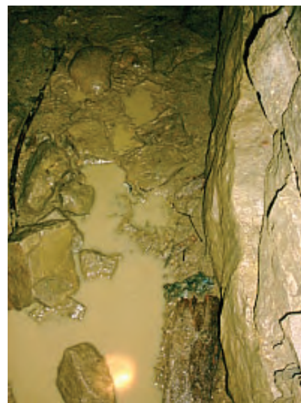
Das ständig herab tropfende Wasser bildet auf dem Lehm Boden des Knickganges Wasserlachen.

gels). Allerdings handelt es sich hierbei ausschließlich um eine behelfsmäßige Nachnutzung des bereits vorher vorhandenen Ganges. Denn optimal geeignet war er weder für den einen wie den anderen Zweck. Als kurzfristiger Unterstand könnte er wohl dienen, aber das im abgknickten Teil des Ganges ständig von der Decke tropfende Wasser,