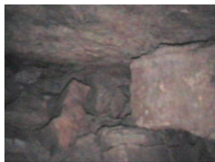
Die hintere Abschlussmauer stammt noch aus der Zeit der Errichtung der Kammer, bevor der Hügel aufgeschüttet wurde, denn sie wurde von außen angesetzt, wie die Details zeigen (oben: rechte Seite, Mitte: linke obere Seite, unten: rechte obere Seite)