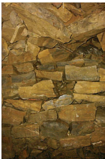
Die hintere Abschlussmauer von Grab 2

Da die Grabstätten dieser Anlage durch Grabräuber geplündert worden sind, ist es eigentlich unverständlich, warum diese Mauer übersehen und nicht aufgebrochen wurde, denn sie lädt geradezu ein, aufgebrochen zu werden. Hinter der Mauer muteten wir ein Gang aus, auch dieser folgt dem Diagonal-Gitternetz. Oberirdisch konnten wir den Gang nur einige Meter weit verfolgen, bis es durch einige herum liegende Steinblöcke und starken Bewuchs unmöglich wurde, das Ende zu lokalisieren.