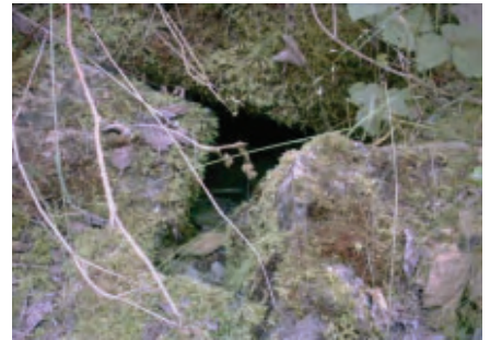
Ein vierter ehemaliger Grabzugang. Auch dieser ist zusammengebrochen und verschüttet.

Links: Risszeichnung der Kammer des 2. Grabes. Der Gang hinter der Verschlussmauer ist gemutet (GLG)