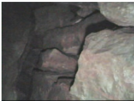
Hier die rechte Seite des Zuganges von Grab 2. Die Konstruktion ist ähnlich wie bei dem Ganggrab des „Kartoffelhügels“.

Hinter dem engen Durchgang gelangt man in einen relativ großen Raum (geschätzte drei Meter Länge, 1,60 Meter Breite, 1,70 Meter Höhe, was ursprünglich möglicherweise ebenfalls den megalithischen Maßen entsprach), dessen Wände nicht sehr sorgfältig erstellt wurden (vielleicht hängt der Zu-