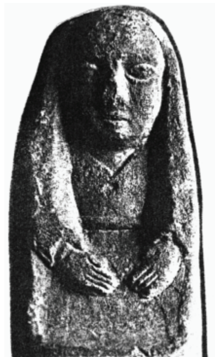
Figuren vom Cerro de los Santos (Albacete, Spanien) (M. Tarradell, Arte Ibérico 1968)

„Natürlich das Original!“ (denn so kostbar ist es nun auch nicht mehr).