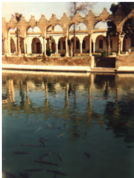
Der Teich Abrahams in Edessa mit den heiligen Fischen

Schon auf den ersten Blick verrät der geschminkte Mund die Zeitströmung durch seine Erotik: so empfand man Frauenschönheit um 1900. Auf die