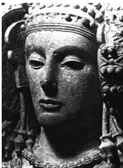
Die „Dame von Elche“ mit dem erotischen Mund. Marmorfigur im Archäologischen Nationalmuseum (Madrid)

Mit dem Herstellen und Auffinden von Kunstgegenständen der Antike ist