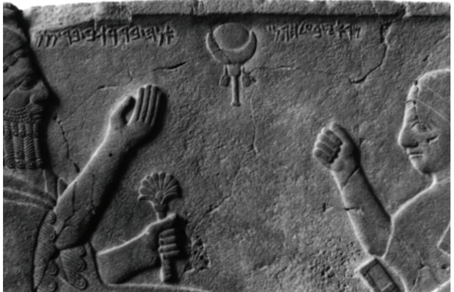
Die phönizische Stele der Barmekiden im Berliner Pergamon-Museum

laart reiste in die Türkei, heiratete eine Türkin und beschäftigte sich beruflich mit Archäologie. Damals, um 1955, gab es dort einen regen Handel mit hübschen Keramikfiguren, die jungsteinzeitlich sein sollten. Mellaart ging der Sache nach und fand die Herkunft heraus: Sie stammten aus dem kleinen Ort Hacilar am Burdur-See. Er kaufte viele Figuren und begann 1957 mit der Ausgrabung der vorgeschichtlichen Siedlung, die bis 1960 andauerte. Das von ihm gefundene jungsteinzeitliche Dorf unter der kupfersteinzeitlichen Siedlung haben nur wenige Fachleute gesehen, aber es gibt schöne Zeichnungen, Fotos und Beschreibungen davon. Nach dem Ende der Grabungskampagne wurde nämlich alles wieder zugeschüttet, vor Ort sieht man nichts mehr, wie wir 1966 mit Be-dauern feststellen mussten.