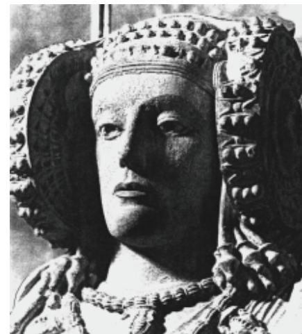
Die „Dame von Elche“ im Archäologischen Nationalmuseum (Madrid)