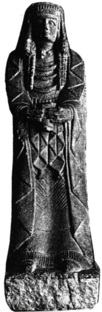
Die „Große Dame“ vom Cerro de los Santos, Albacete, Spanien (M. Tarradell, Arte Ibérico , 1968, Abb. 59)

„Wenn es sich tatsächlich um das Arbeitsexemplar des Dichters handelt, so entstand der Beowulf also in der Zeit der Schreiber, also im 10. oder 11. Jh.