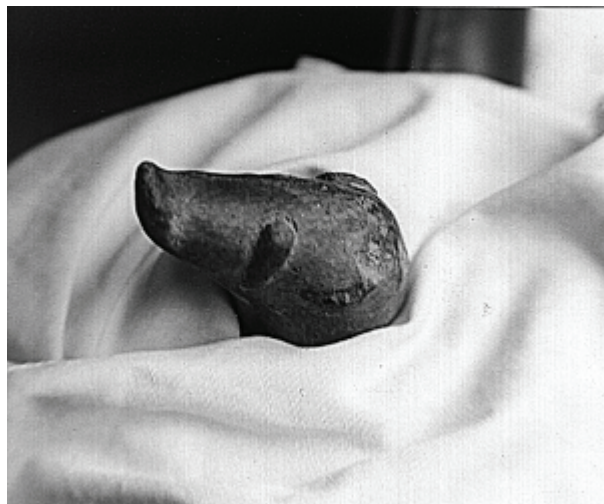
Ein Keramik-Schweinskopf aus Hacilar am Burduree, Türkei

se noch viel schönere Funde und Wandgemälde aufwies, sind sein Ruhm und die neolithische Hochkultur Anatoliens gerettet. Auch diesen unterirdischen Ort kann man nicht besichtigen, nur die Fundstücke in den Museen – besonders prächtig in Ankara – bewundern (wie ich vor zwei Jahren noch).