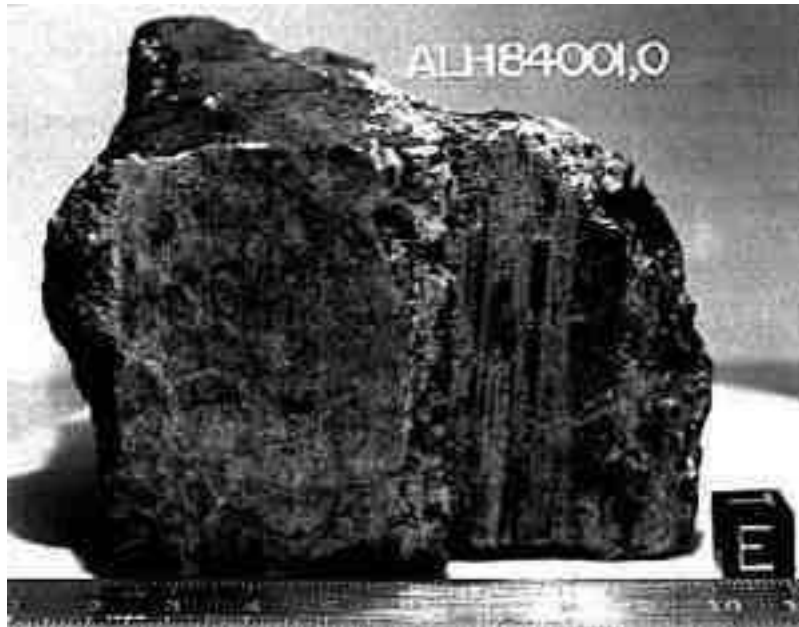
Der Meteorit "ALH84001", ein Steinbrocken vom Mars? (NASA)

Eine "Sensationsmeldung" ging Anfang August 1996 um die Welt, herausgegeben von der NASA: "Wir haben Leben auf dem Mars gefunden!". Zeitungen und Illustrierten beteiligten sich sogleich an der Verbreitung dieser Meldung, so beispielsweise das Magazin "Focus" mit der Titelstory "Ist da draußen doch wer? Hintergründe und Folgen der Wissenschafts-Sensation" (1).