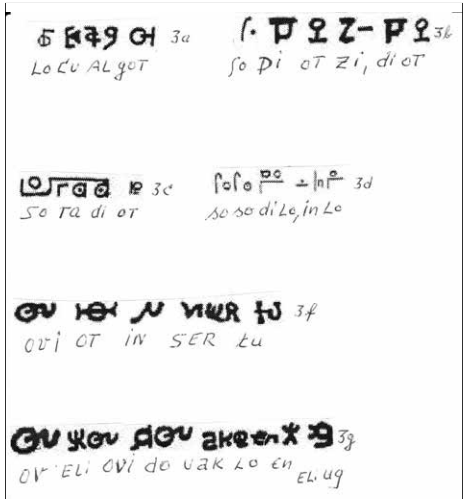
Abb. 3a - g

Klimawandel, für den wir schwer zahlen müssen? Die zwei einzigen Ursachen für die von Menschen gemachte Klimaveränderung sind die militärischen Klimaversuche der USA, Großbritanniens, Russlands und Chinas sowie die Überbevölkerung und die daraus resultierenden Kriege und Völkerwanderungen. Alle nach West- und