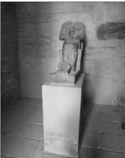
Die kopflose Statue des Gottes Ptah in einem Nebenraum.

weitere Sensation war im März 2012 der Fund von Teilen eines Sandsteintors aus der 17. Dynastie. Das Tor trägt Hieroglyphen mit dem ersten zeitgenössischen Hinweis auf den nahezu unbekanntem Pharaon Senacht-en-Re, dessen Name bisher nur in drei Dokumenten aus späteren Dynastien auftauchte.