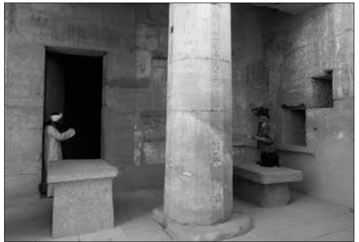
Links: Blick vom Dach des Tempels auf den Zugang mit den einzelnen Pylonen. Rechts: Die Haupthalle mit Altären und der Tür zu dem Raum, in dem das Standbild der Göttin Sechmet steht.