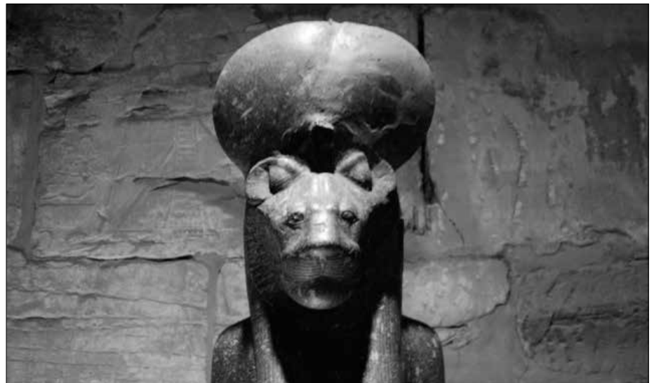
Links: Das Standbild der löwenköpfigen Göttin Sechmet (mit „Orb“). Rechts: Der Kopf Sechmets.

lich im Hof des Mittleren Reiches des Amun-Tempels. Irgendwann im Altertum wurde er in den Ptah-Tempel geschafft.