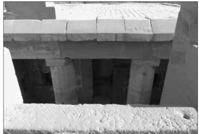
Blick vom Dach des Tempels. Links: Das Tempel-Hauptgebäude. Rechts: Blick auf die Haupthalle.