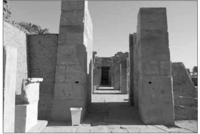
Links: Der recht unscheinbar wirkende Ptah-Tempel. Rechts: Blick vom Zugang durch die Pylone auf den Tempel.