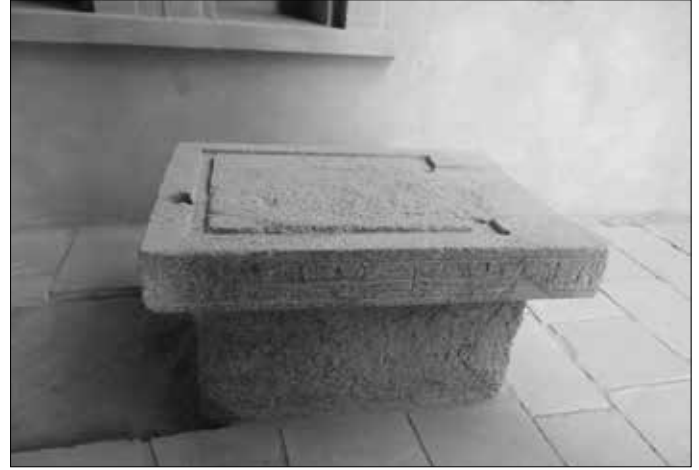
Zwei der Altäre im Heiligtum. Hier wurden angeblich Blutopfer dargebracht.