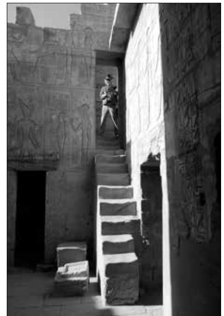
Der Aufgang zum Dach des Tempels.