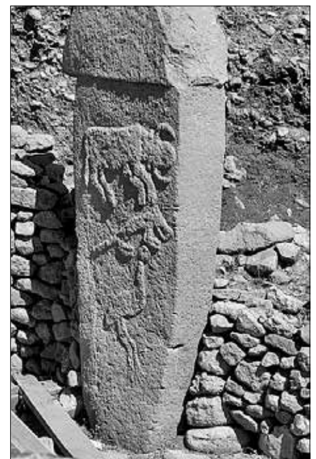
Bild 10: Die Stelen in Göbekli Tepe tragen wunderschöne Tierdarstellungen.

Bilder 9 und 10: Wikipedia, Stichwort Göbekli Tepe.