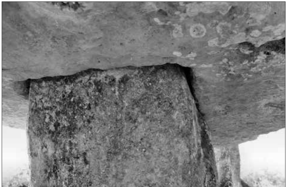
Bild 6: Auch in diesem Tempel wird der Deckstein über eine Nut gehalten.