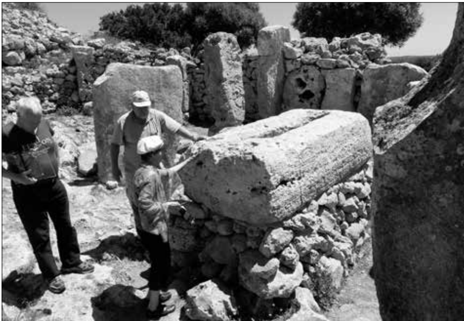
Bild 8: Im Zentrum steht noch der Stein, der die große Taula bildete. Die Abdeckung fehlt. Sie liegt daneben aufgebahrt wie ein Sarkophag.