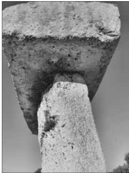
Bild 3: Auf der Unterseite befindet sich eine Nut, die dem aufgelegten Stein einen sicheren Halt gibt.

Warum erbringen Menschen bauliche Leistungen, die enorme Anstrengungen erfordern? Meiner Meinung nach aus Angst. Tempel und Grabanlagen in der Frühzeit wurden aus Angst um den Verlust der Unsterblichkeit oder aus Angst um ewige Verdammnis gebaut. Christliche Kirchen und Kathedralen im Mittelalter wurden auch aus Angst vor der Verdammnis und dem Verlust des Zugangs zum Paradies errichtet. Welche Angst hatten die frühen Bewohner Menorcas? Ich habe einen Verdacht, dass es die Angst war, nicht genügend Wasser für das Überleben von Mensch, Tier und Pflanzen zu haben.