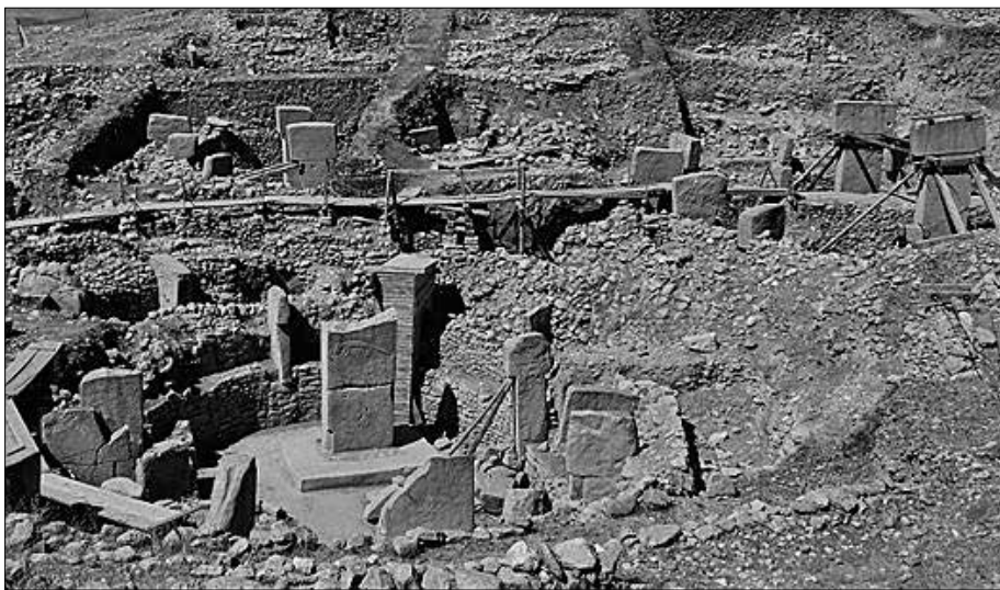
Bild 9: Ausgrabungen in der Tempelanlage von Göbekli Tepe (Türkei).

Mittelmeerraum brachten? Was wissen wir überhaupt über die Zeit zwischen -11000 und -3000? Meines Wissens gar nichts. Unsere offizielle Geschichte beginnt um -3000 mit den Ägyptern, den Sumerern und der Induskultur. Und davor? Was wissen wir über die klimatischen Verhältnisse um -7500 in Göbekli Tepe, als die Bewohner ihre Anlagen zuschütteten? Könnte es sein, dass dramatische Klimaveränderungen die Göbekli-Kultur zur Auswanderung trieb? Immerhin war der Glaube an ihre Welt- oder Göttervorstellung so stark, dass man die Tempel nicht einfach zerstörte oder sich selbst überließ. Man schüttete sie sorgsam zu. Vielleicht in der Hoffnung, eines Tages zurückzukommen. In der Ferne – in unserem Fall auf Menorca – lebte der Glaube und die