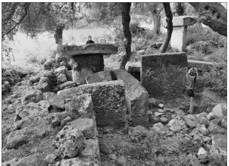
Bild 4: Eine zerfallene, aber trotzdem sehr repräsentative Tempelanlage, der Tempelbereich beim Torre Llafuda.

Auch Yukatan war Karstgebiet. Das Wasser war im Untergrund gespeichert und trat in sogenannten Cenotes - runden, sehr tiefen Wasserspeichern - an die Oberfläche. Im Laufe der Zeit änderte sich in Mexico jedoch das Klima. Es wurde trockener. Damit begann der Kampf ums Wasser, ein Kampf ums Überleben, der letztendlich zur Auflösung der Maya-Kultur führte. Immer heftiger wurden die Götter um